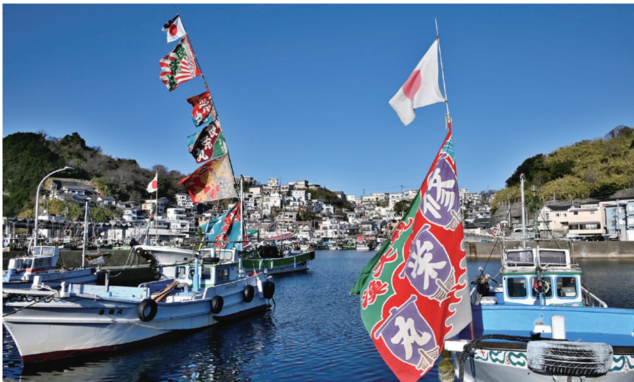
画題「大漁旗」 和歌山市雑賀崎 雑賀崎漁港の旧正月の風景