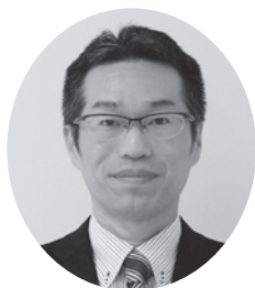
和歌山県職員労働組合

この一年が、皆様にとって幸ある年となりますことをお祈り申し上げ、年頭の御挨拶といたします。