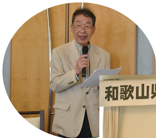
司会の住吉副会長