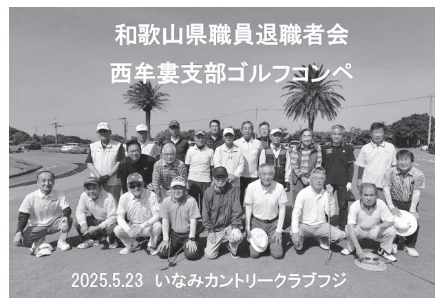
和歌山県職員退職者会 西牟婁支部ゴルフコンペ