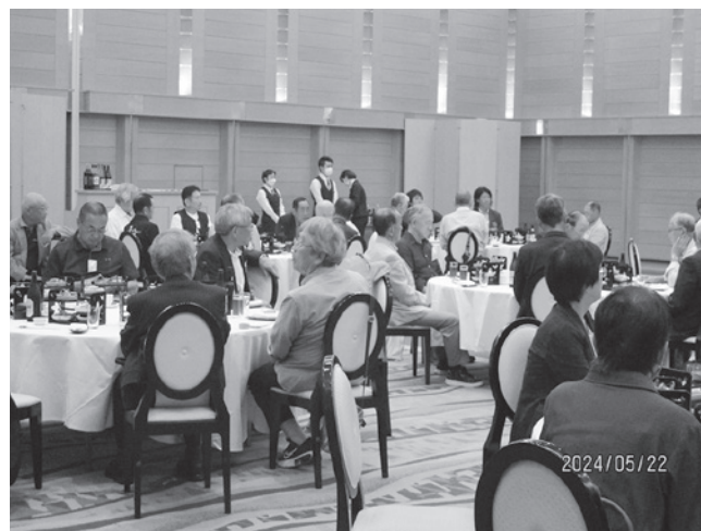
〈昨年の総会・懇親会 (令和6年5月22日)〉