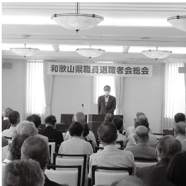
〈昨年の総会(令和4年5月27日)〉

場所 アバローム紀の国 和歌山市湊通丁北2丁目1-2 TEL : 073 - 436 - 1200