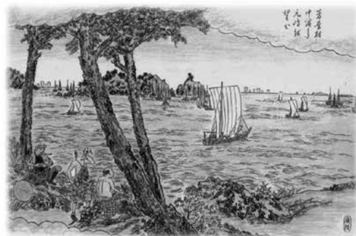
芳養から元島を望む (紀伊国名所図絵より)

さらに進むと、芳養八幡神社の例大祭の宵宮に潮垢離を行う地があります。この場所から芳養湾に浮かぶ元島などが見えますが、かつて紀伊名所図絵に描かれた時より浸食されたので、島が少し小さく感じられます。国道に沿って進むと弓道場のある目良の交差点にでます。ここからは、南に直進して 潮垢離浜 に行くコースと、右折して 天神崎 を経由するコースに分かれます。