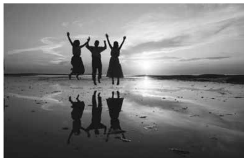
ウユニ塩湖と同じ景色

海岸に沿って 元島 、 弁天島 を間近に見ながら 目良漁港 を進むと間もなく 天神崎 に着きます。ここでは、日本におけるナショナルトラスト運動の先駆けとして有名な所で、自然を守る保全活動が実施されています。