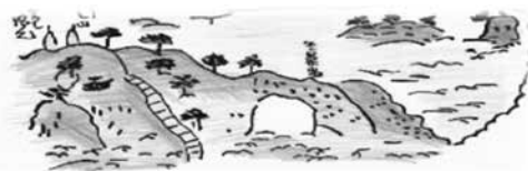
牛の鼻 (熊野詣紀行より)

国道と合流して進むと 牛の鼻 に着きます。昔は海辺に突きだした丘陵の先端に巨岩の岩穴があり、田辺に入った旅人はこの奇岩に感嘆したと云われています。現在は国道工事や埋め立てにより見る影もありません。